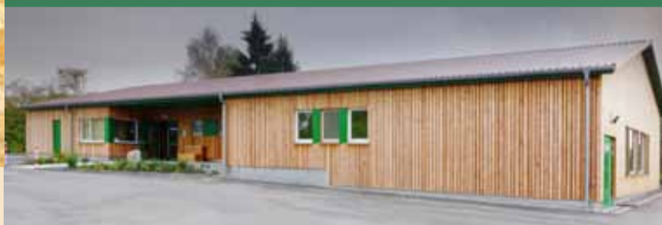
Mehrgenerationentreff, Am Sandradl 20