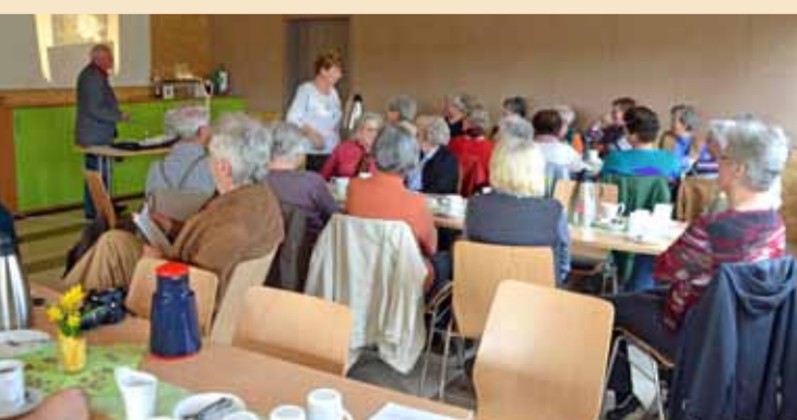
Seniorencafe jeden dritten Mittwoch im Mehrgenerationentreff